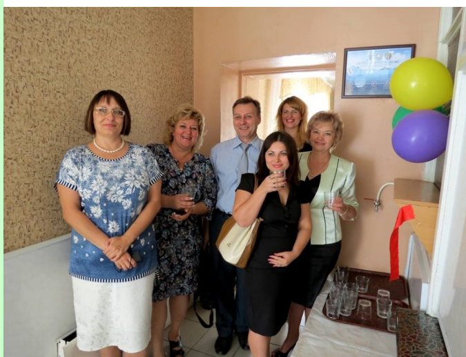
Пьем очищенную воду!