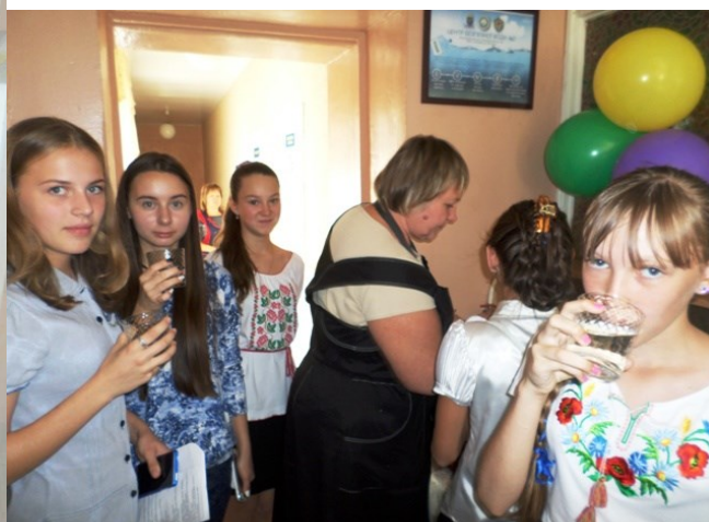
Журналисты первыми пробуют воду из установки