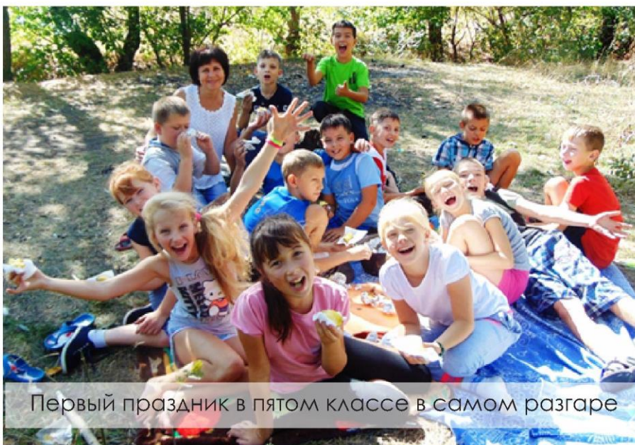
Первый праздник в пятом классе в самом разгаре

была вкусная, да и свежий воздух способствовал аппетиту.