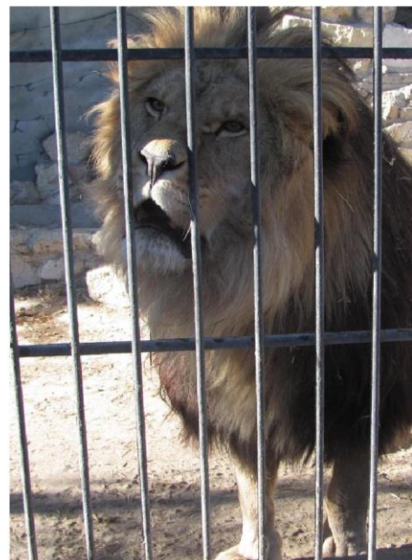
Любопытные обитатели васильевского зоопарка