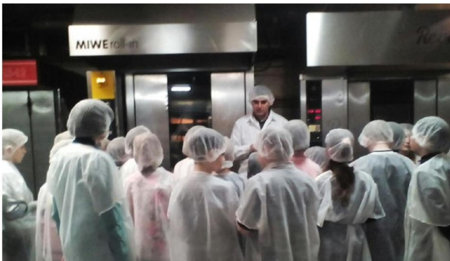
Кондитерское дело - кропотливое, требует аккуратности, внимания и идеальной чистоты

Здравствуйте, все те кто сейчас читает эту газету!