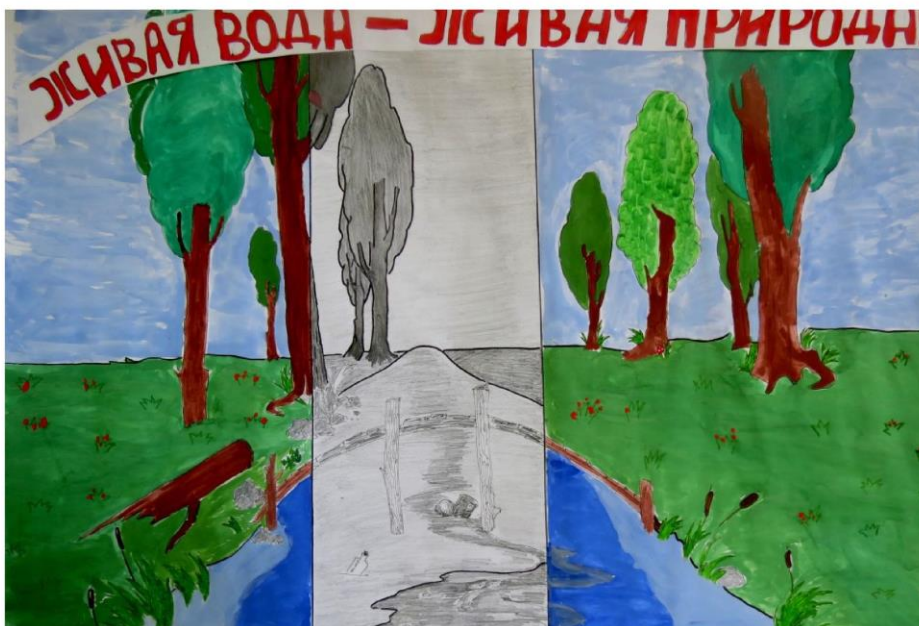
Стенгазета 5-А, подготовленная по случаю Дня Воды