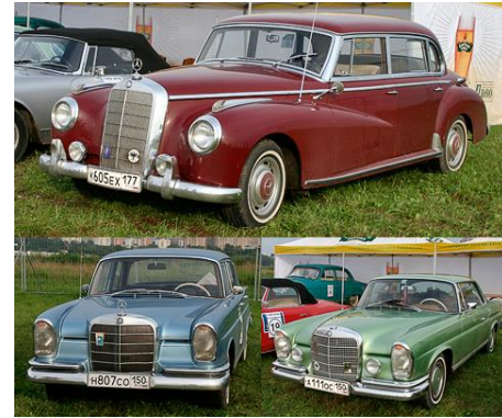
Машины 80-десятых !!!

В 1886 году была создана трёхколёсная самоходная повозка с бензиновым двигателем. В этом же году её создатель – Карл Бенц получил патент на это изобретение. Первый в мире трёхколёсный автомобиль был запущен в серийное производство.